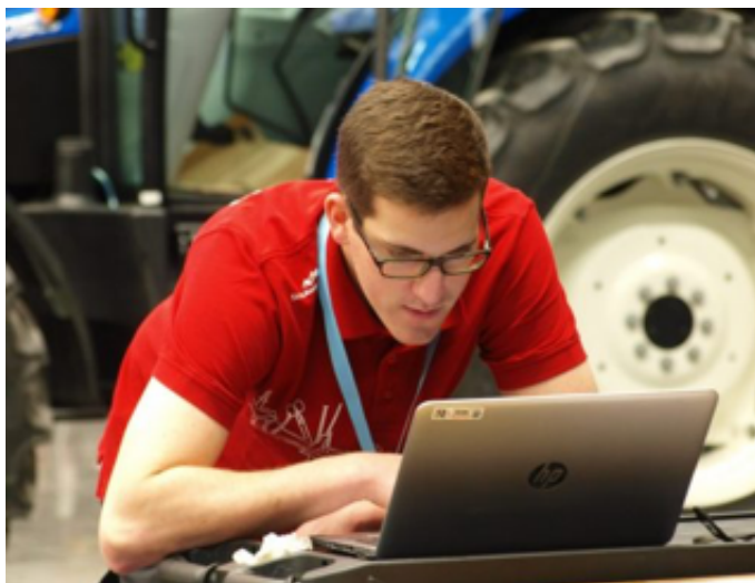
Steyr-Power für den Skill Heavy Vehicle Maintenance