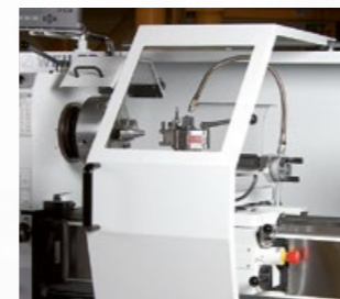
Verfahrbare, umfassende Spänespritzschutzhaube mit Sichtfenster