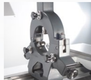
Feststehende Lünette mit Rollenbacken Ø 12–150 mm