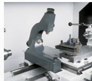
Mitlaufende Lünette mit Gleitbacken Ø 10–160 mm