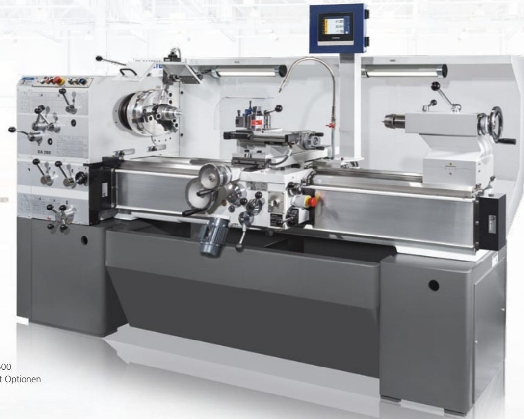
Modell DA 260 x 1.500 Abbildung beinhaltet Optionen