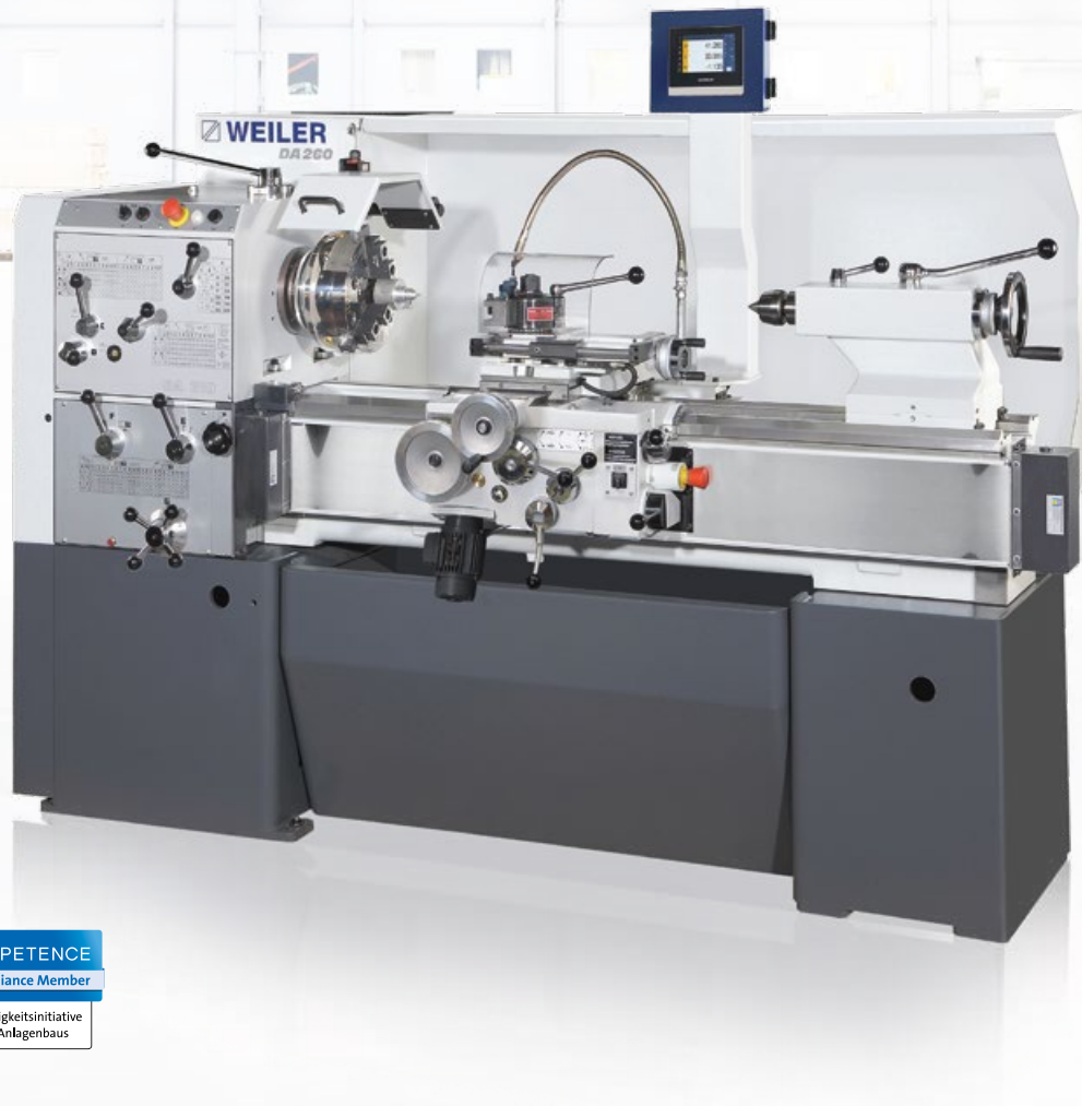
Abbildung beinhaltet Optionen