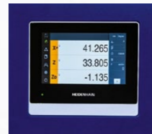
Numerische Positionsanzeige Heidenhain ND7013