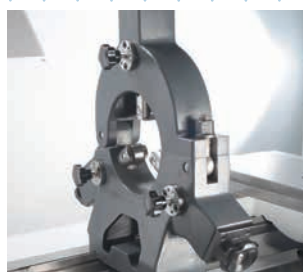
Lunette fixe avec touches à galets Ø 12 – 150 mm