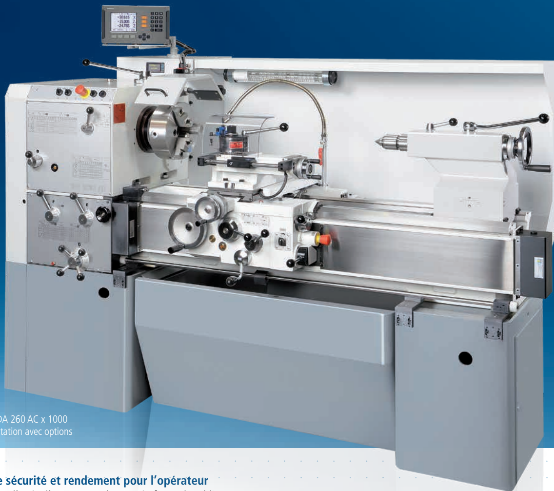
Modèle DA 260 AC x 1000 Représentation avec options