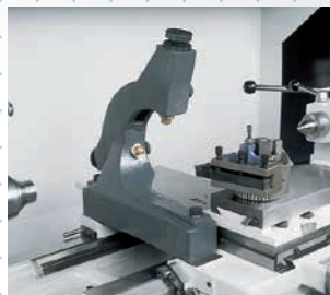
Lunette à suivre avec touches fixes Ø 10 – 160 mm