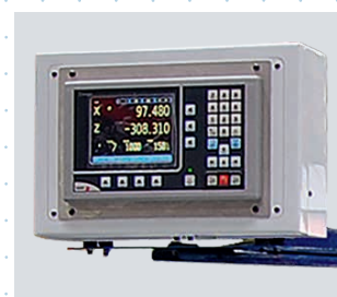
Affichage numérique de position Fagor 40i TS pour 3 axes et fonction vitesse de coupe constante