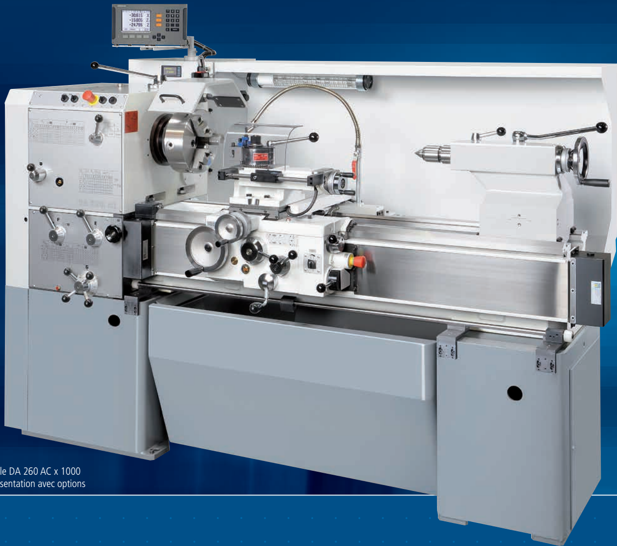
Modèle DA 260 AC x 1000 Représentation avec options

Qualité et précision jusque dans les détails