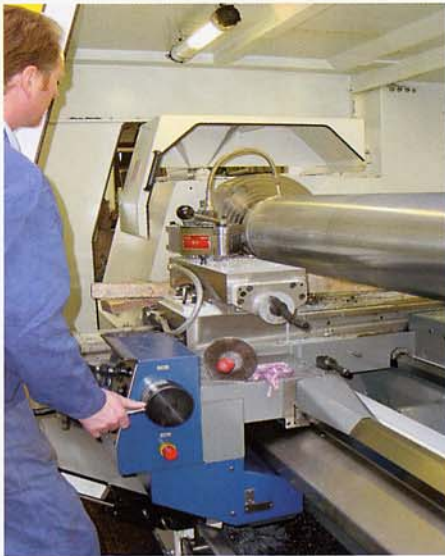
Links und rechts: Die Zyklentechnologie nähert sich der CNC-Technologie laufend an; immer kompliziertere Werkstücke werden gefertigt.